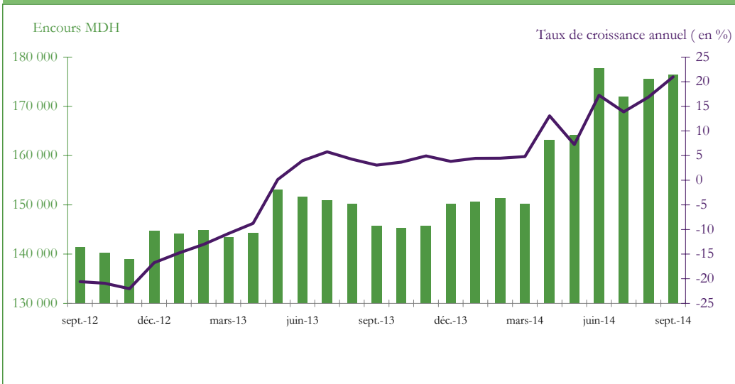
Graphique 3 : EVOLUTION DES RESERVES INTERNATIONALES NETTES